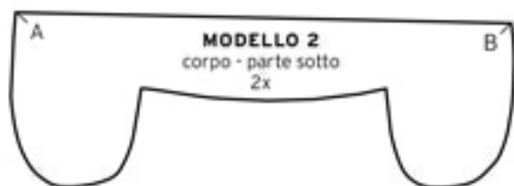
MODELLO 2 corpo - parte sotto 2x