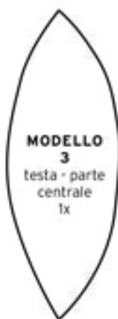
MODELLO 3 testa - parte centrale 1x